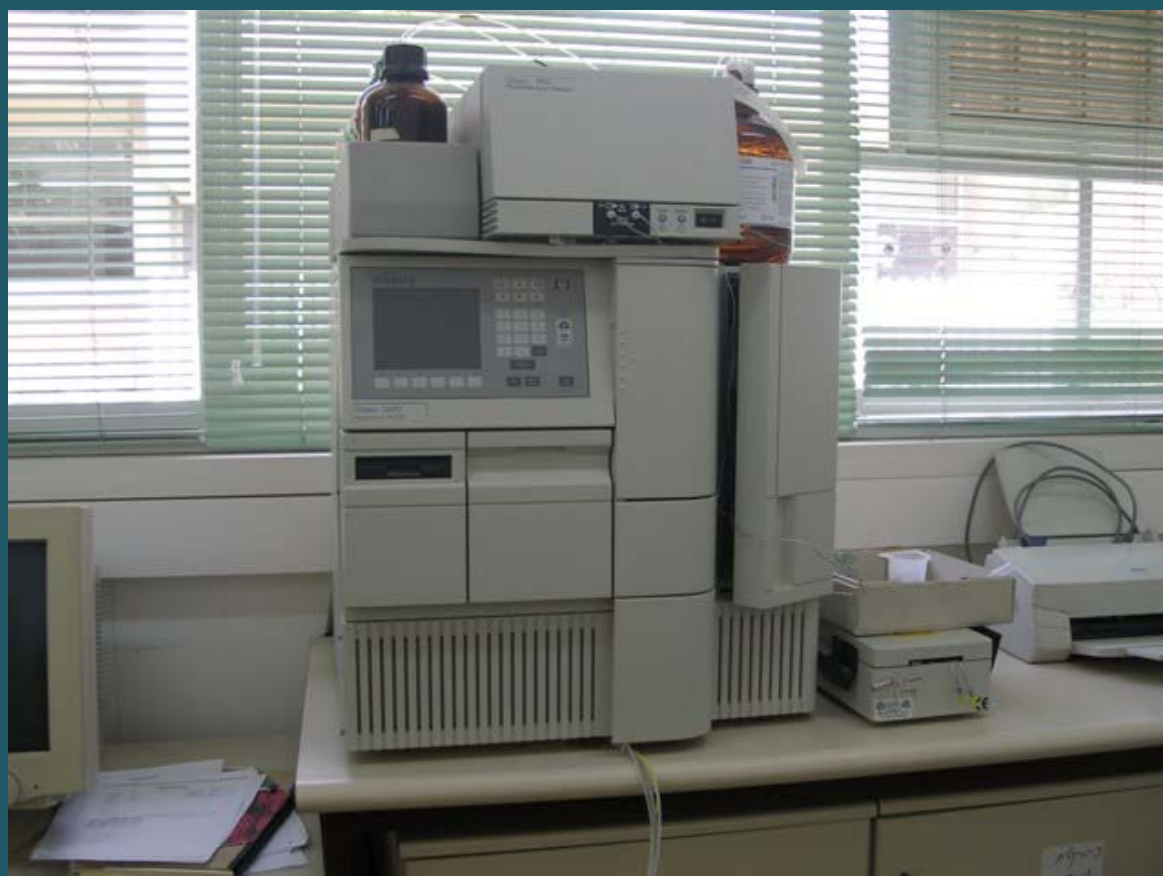
Жидкостный хроматограф (HPLC)