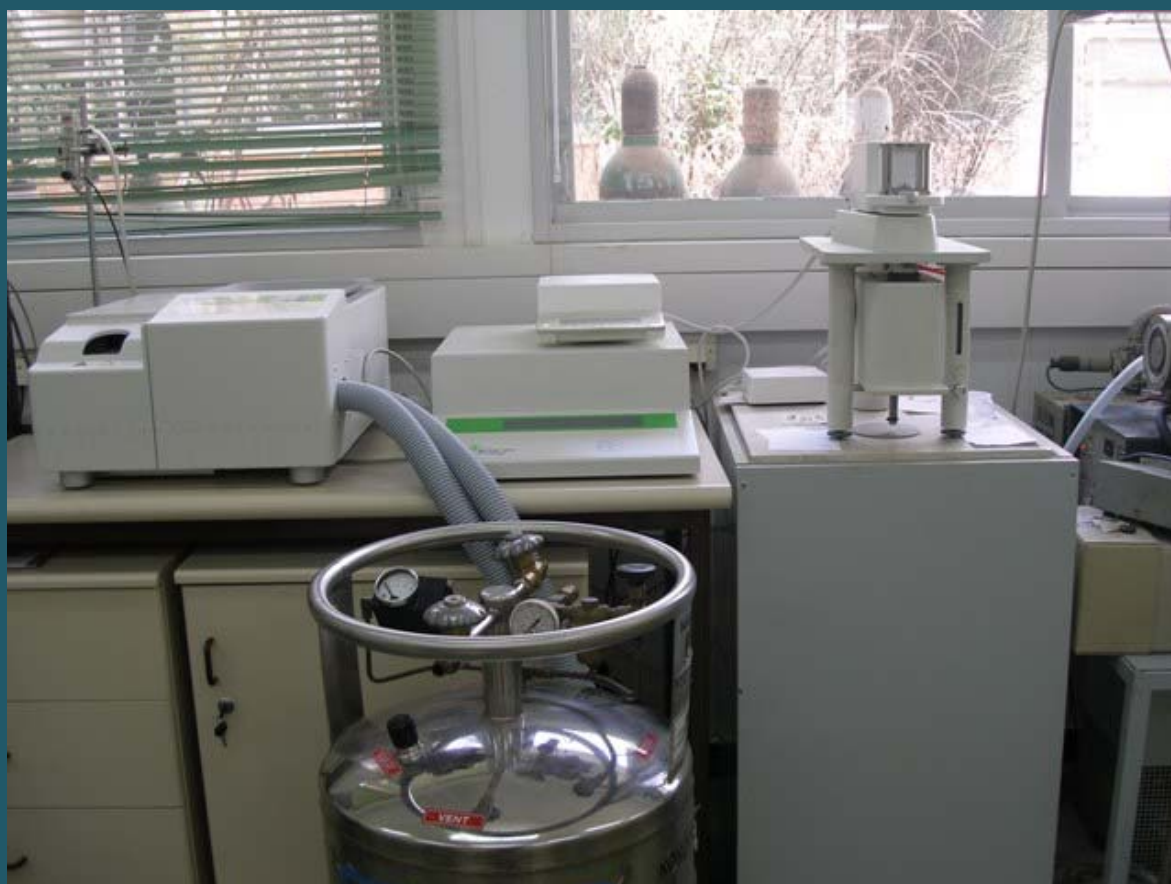
Приборы для термогравиметрии и дифференциальной сканирующей калориметрии