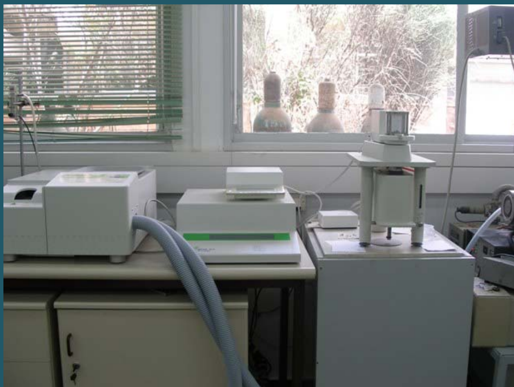
Приборы для термогравиметрии и дифференциальной сканирующей калориметрии (TGA and DSC)