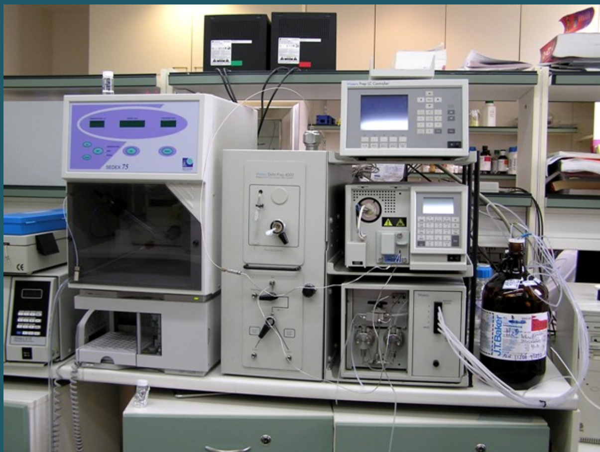
Грепаративный жидкостный хроматограф (HPLC preparative)