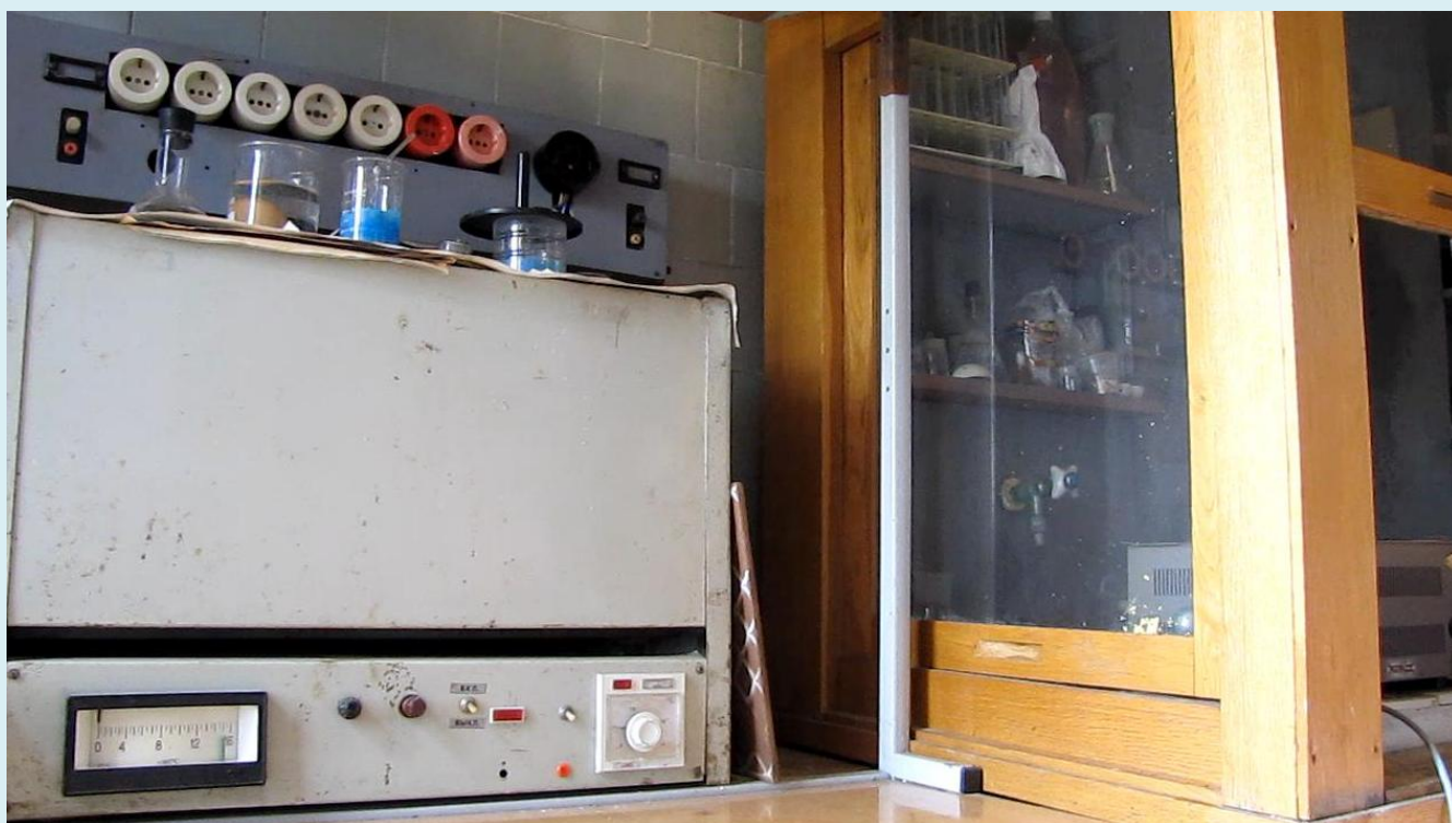
Реакция хлористого водорода и аммиака