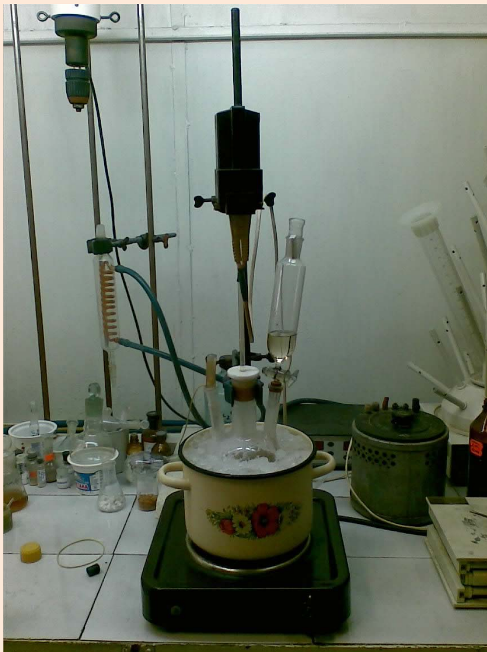
Получение гидрохлорида диэтилового эфира L-аспартата