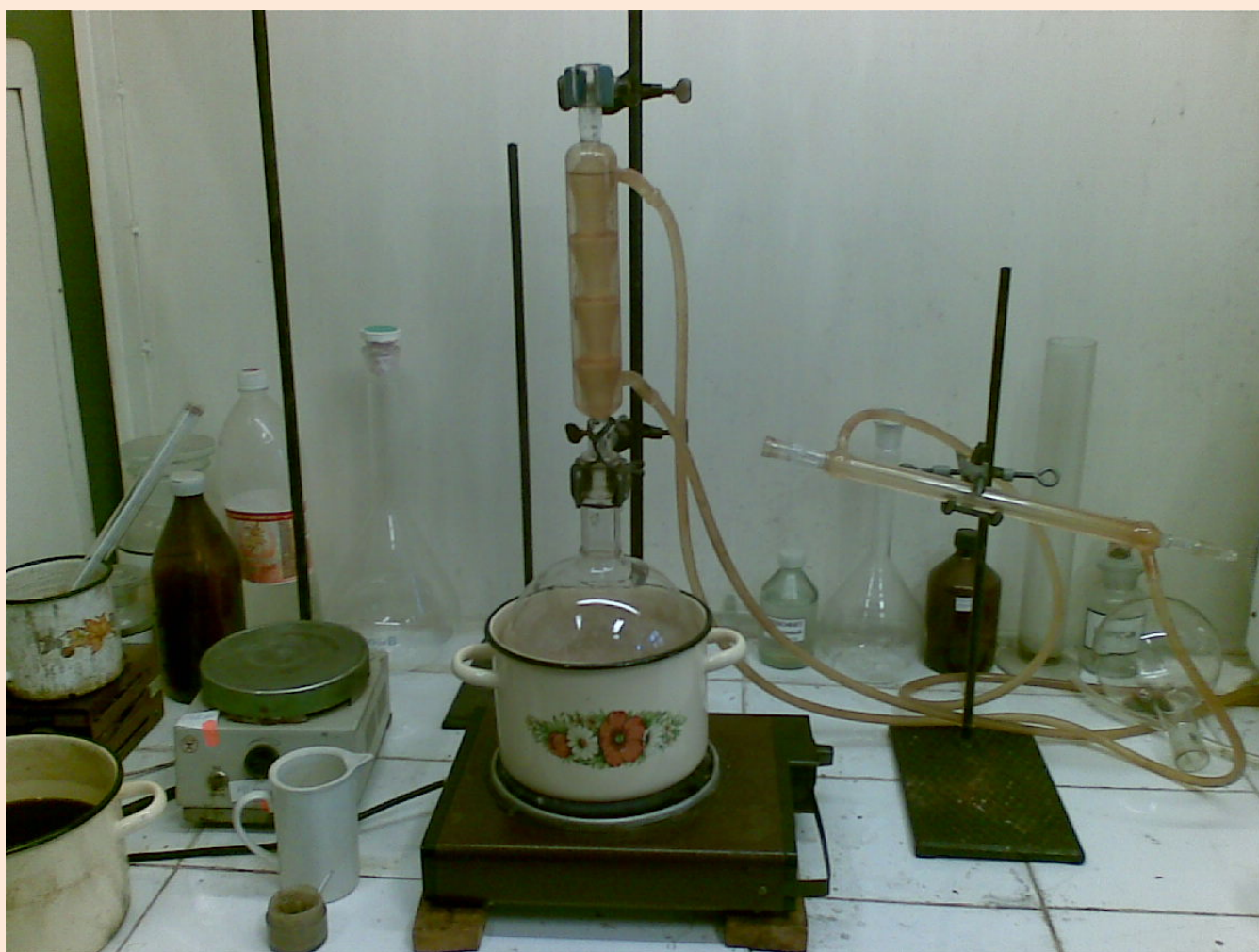
Абсолютирование этилового спирта