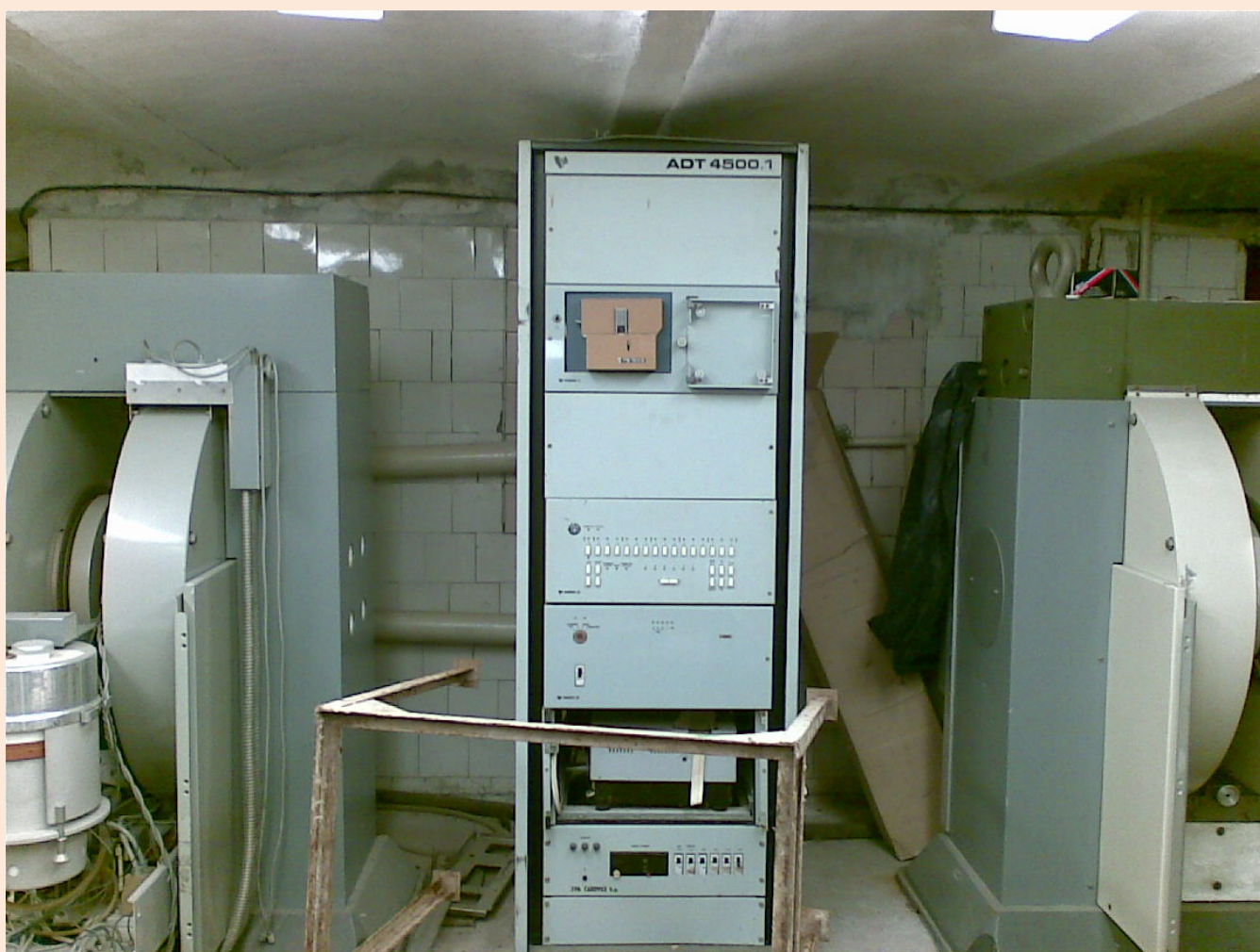
ЯМР-спектрограф (два магнита с программным блоком посередине)