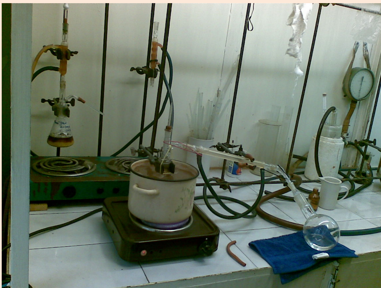
Перегонка под вакуумом