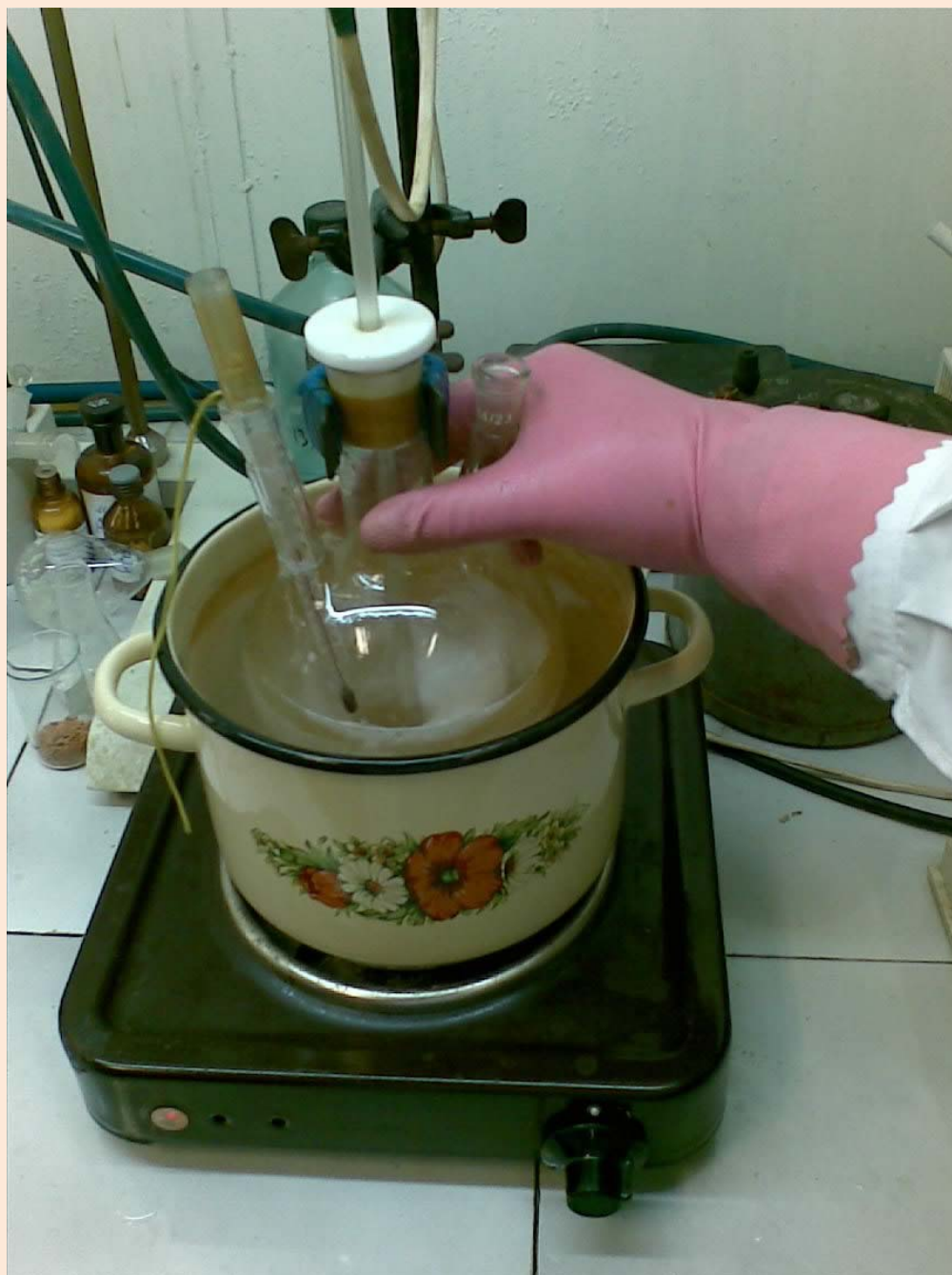
Реакция этерификации в самом разгаре (запах сногшибательный)