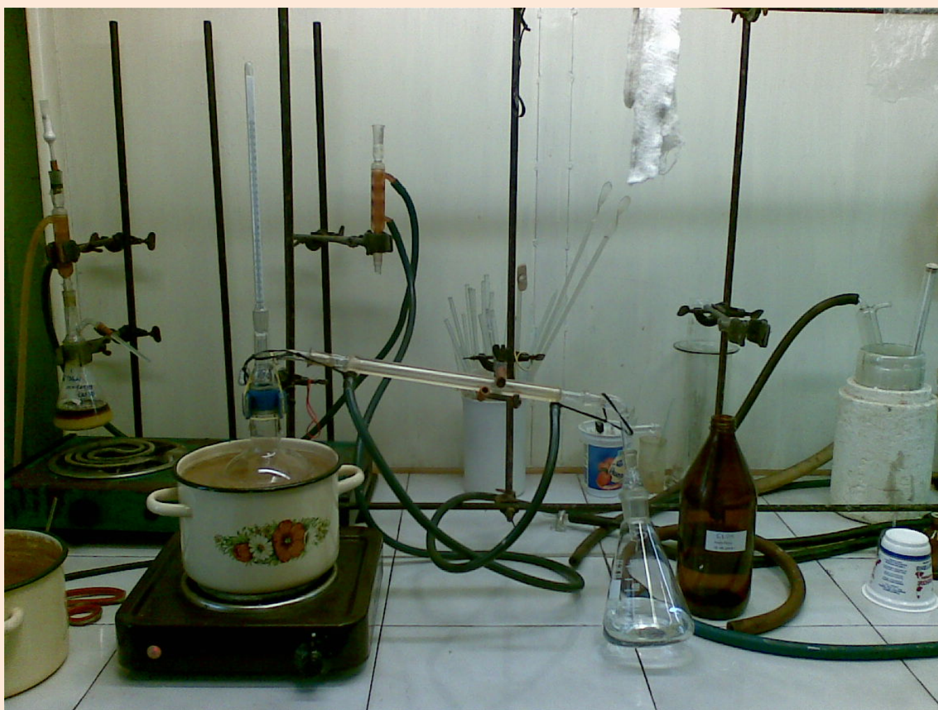
Перегонка с водяным холодильником Либиха