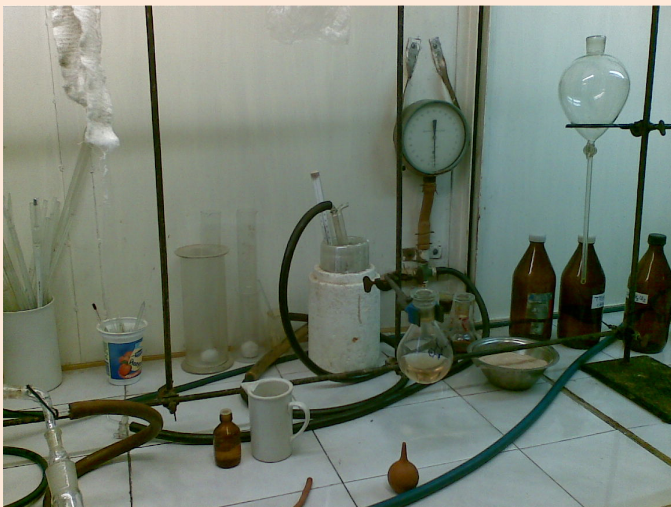
Сосуд Дьюара с ловушкой