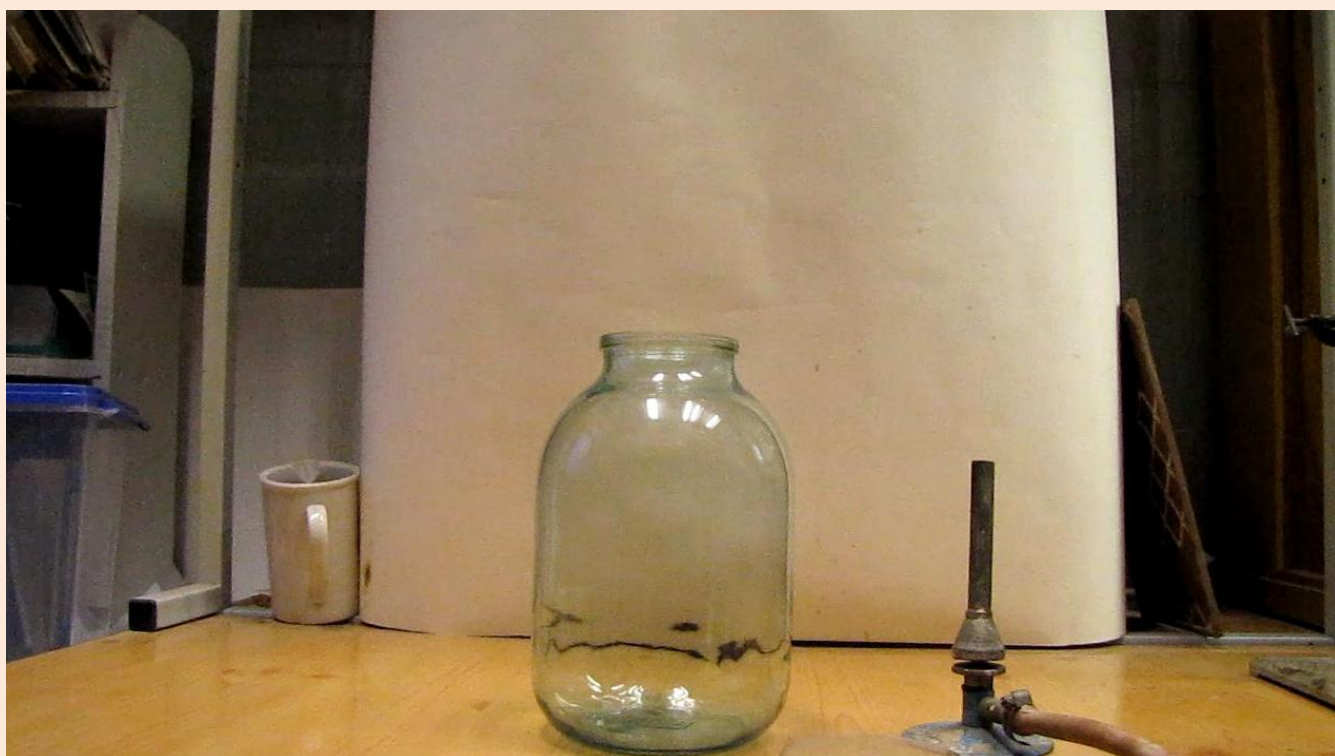
Пропан-бутановая смесь гасит газовую горелку