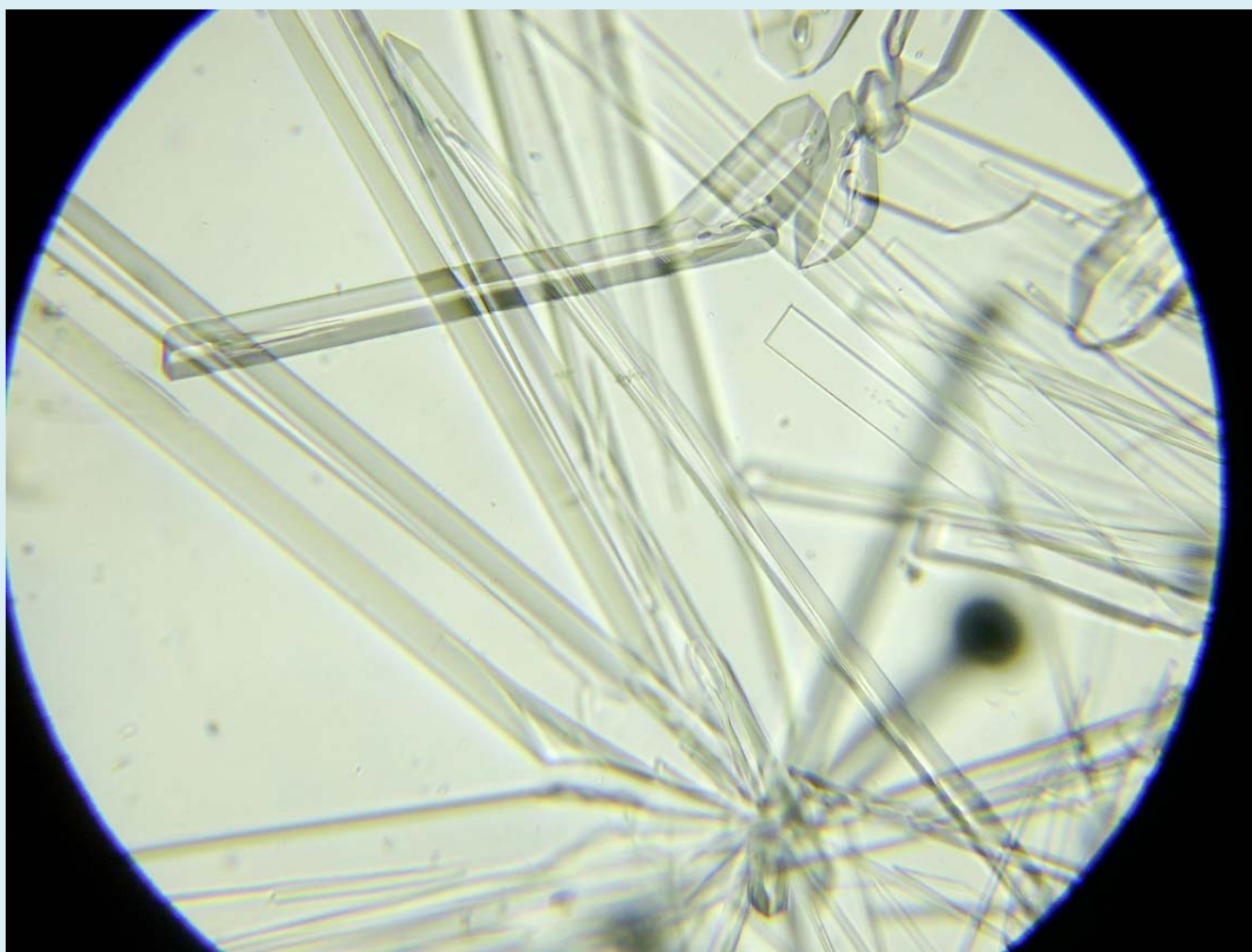
Кристаллы нитрата калия под микроскопом