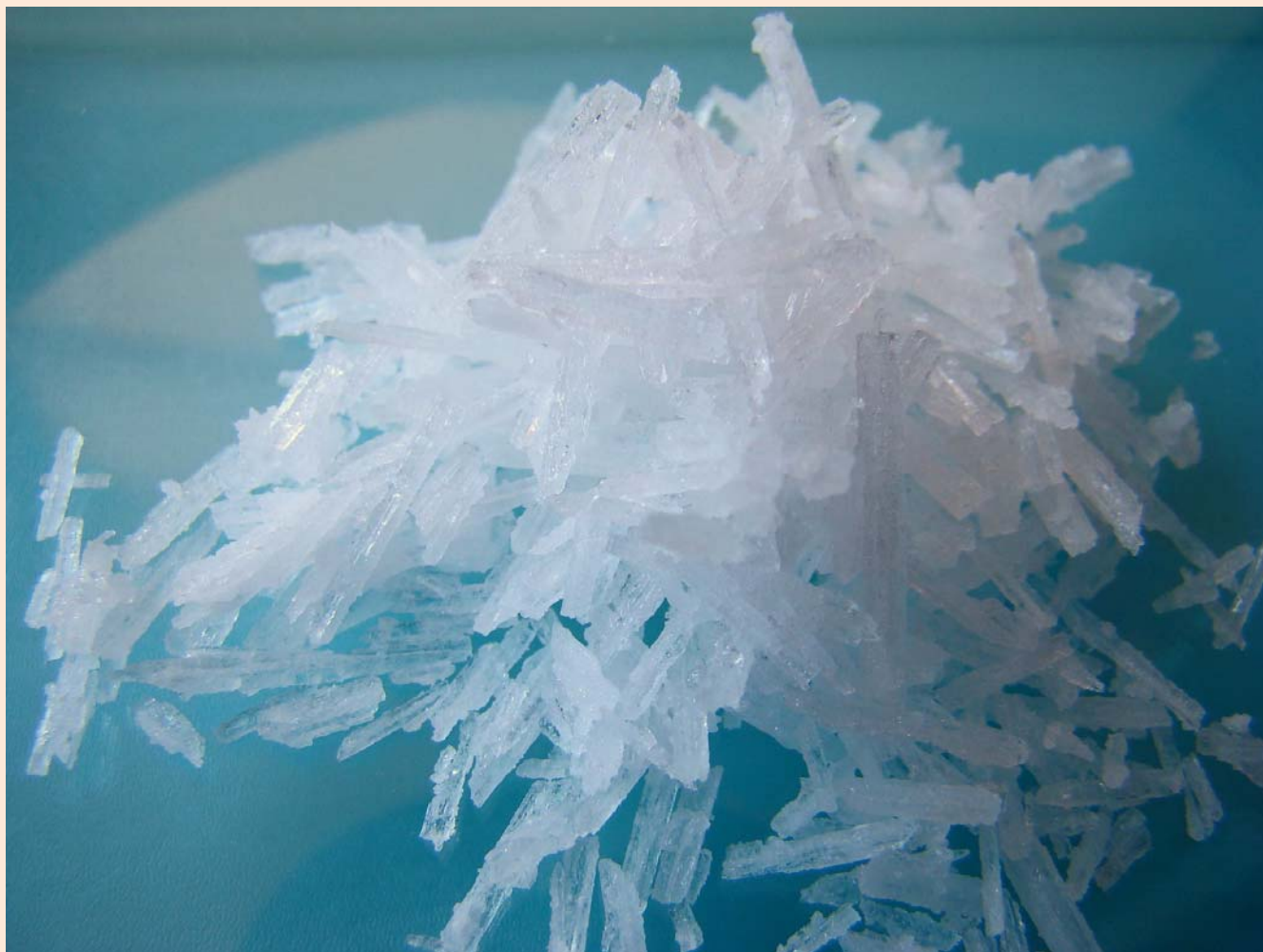
Кристаллы сульфата цинка-аммония