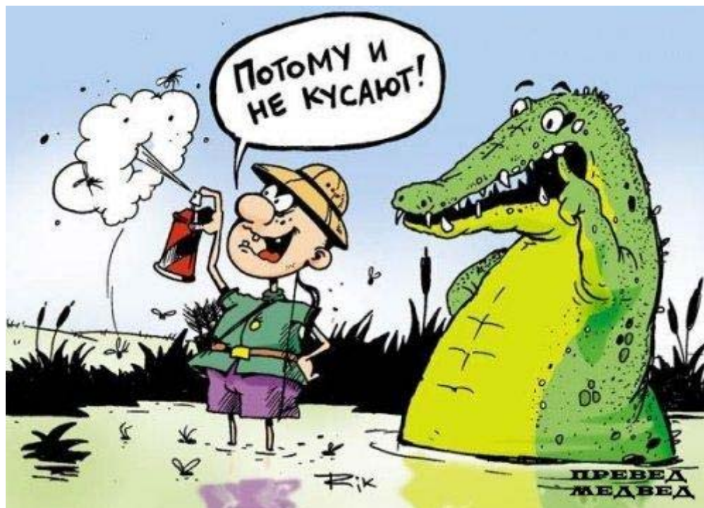
автор Д. Трофимов