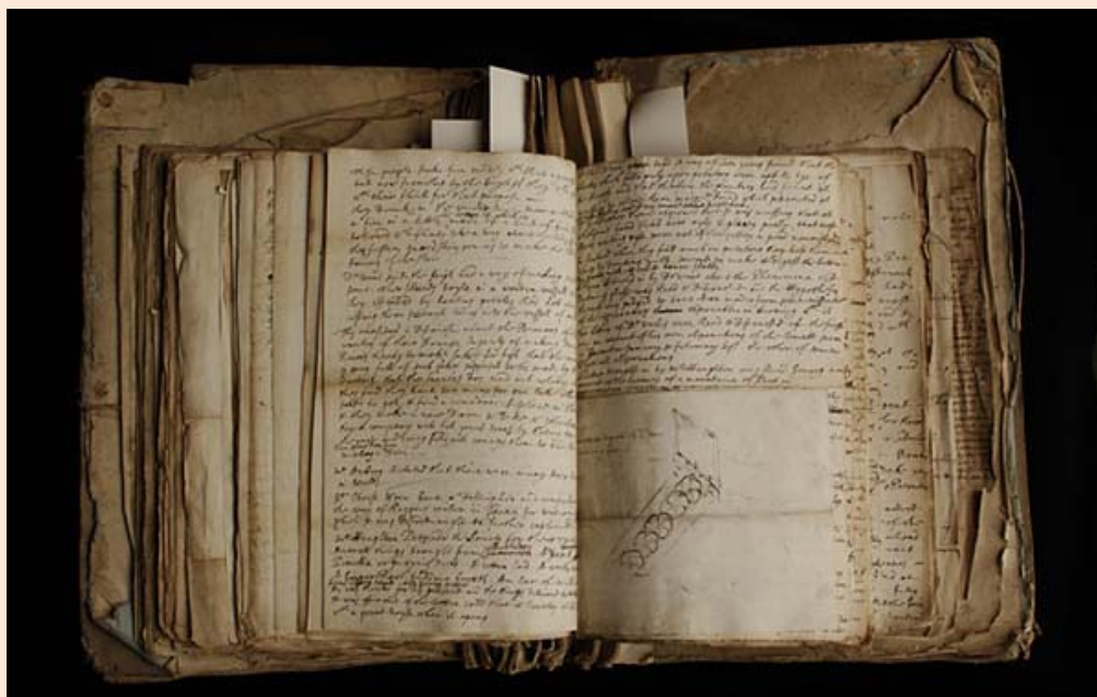
Рукописи Роберта Гука в архиве Лондонского Королевского общества

Поэтому в небольшой стране гений встретит такой же отклик, что и горох, швыряемый об стену. В странах побольше вероятность распознавания гения выше. Поэтому экспедиции отправятся к малым народам и в города, затерянные в глухих провинциях нашей планеты. Может, там - как знать? - удастся найти не узанных ранее второклассников гениальности. Пример Босковича (Югославия) знаменателен: его открыли задним числом; то, что он писал и мыслил столетия назад, было замечено лишь тогда, когда о чем-то подобном стали мыслить и писать ныне. Такие псевдооткрытия Одиссея не интересуют.