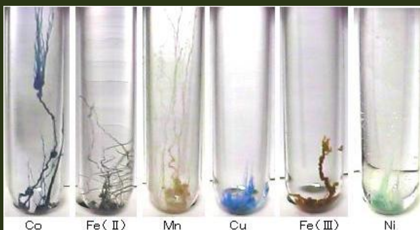
Кристаллы солей различных металлов в растворе силиката калия автор неизвестен