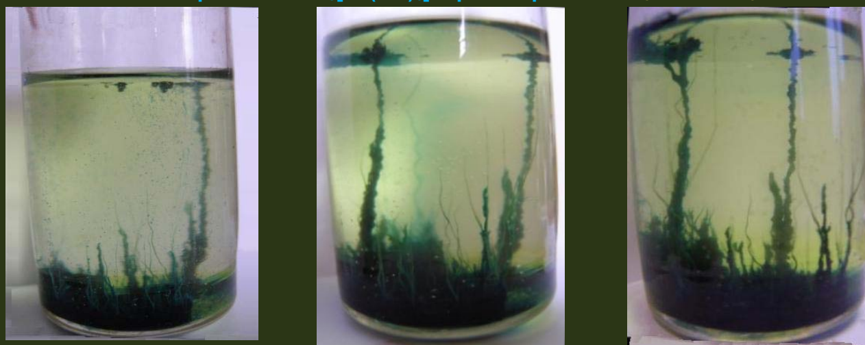
Кристаллы FeCl_3 в растворе K_4[Fe(CN)_6]