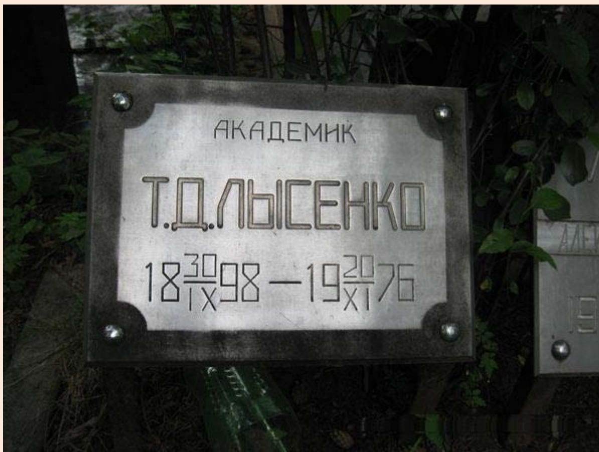
Лысенко умер, но дело его живет – лучше было бы наоборот

Какой главный вывод? Наука и наша Академия Наук – совсем разные вещи, даже альтернативные. Вы должны это четко понимать.