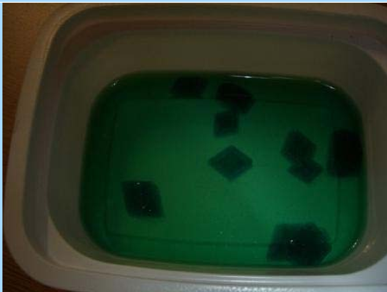
Кристаллы \text{NiSO}_4 \cdot 7\text{H}_2\text{O} (автор Farmacet)