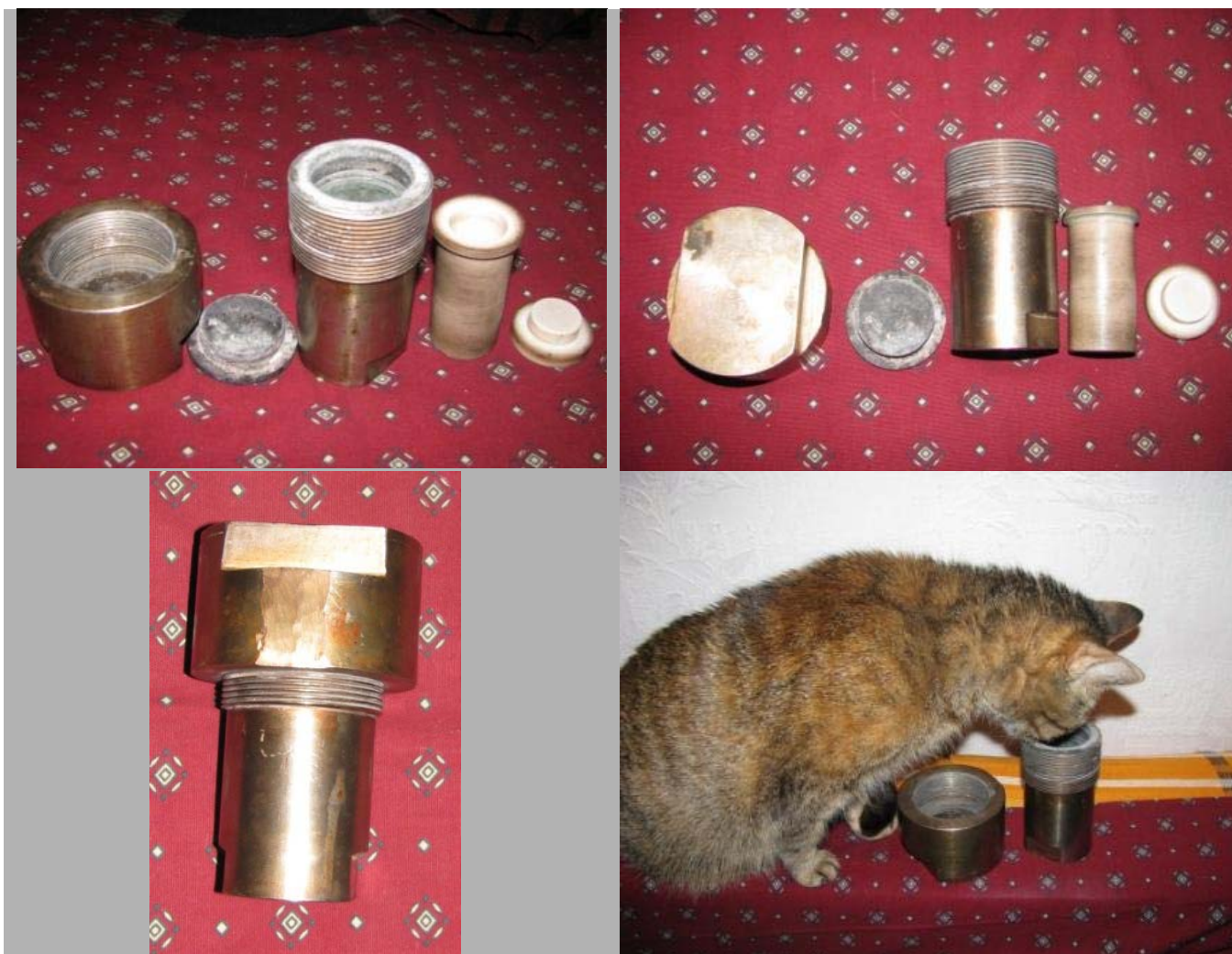
Гидротермальная бомба; Мурка изучает результаты гидротермального синтеза (автор В.Н. Витер)

4, 5 - образуется смесь VO^{2+} и V(V) (зеленый раствор), 6, 7 - образуется чистый хлорид ванадила VO^{2+} (синий), 8, 9 - далее - V(III) (зеленый), 10, 11 - ванадий восстанавливается до V(II) (фиолетовый). Поскольку V(II) легко окисляется кислородом воздуха, раствор при стоянии опять становится зеленым (12) - в результате образования V(III) . 13-18 - осаждение нитрата мочевины действием HNO_3 на крепкий раствор (NH_2)_2CO (автор В.Н. Витер)