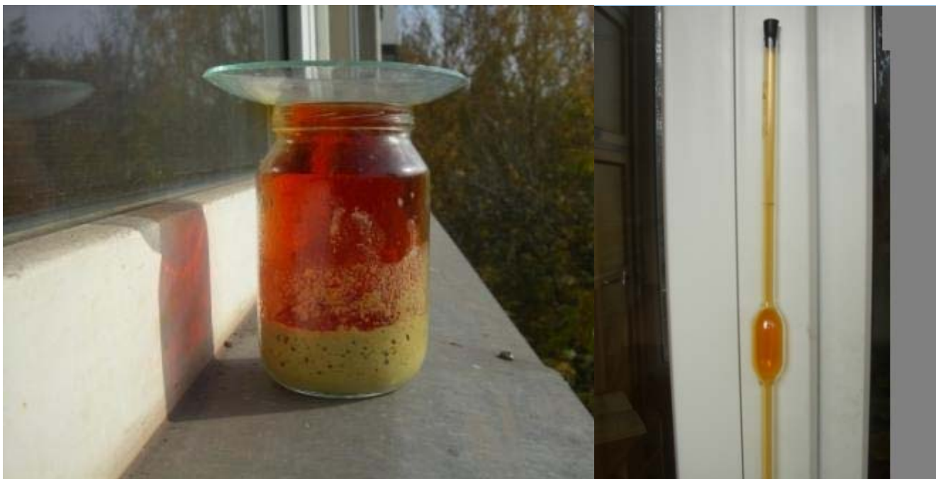
Домашние опыты с \text{NO}_2 (автор Farmacet)