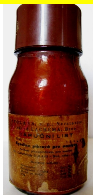
Kyselina pikrová (пикриновая кислота, производство Чехословакия)