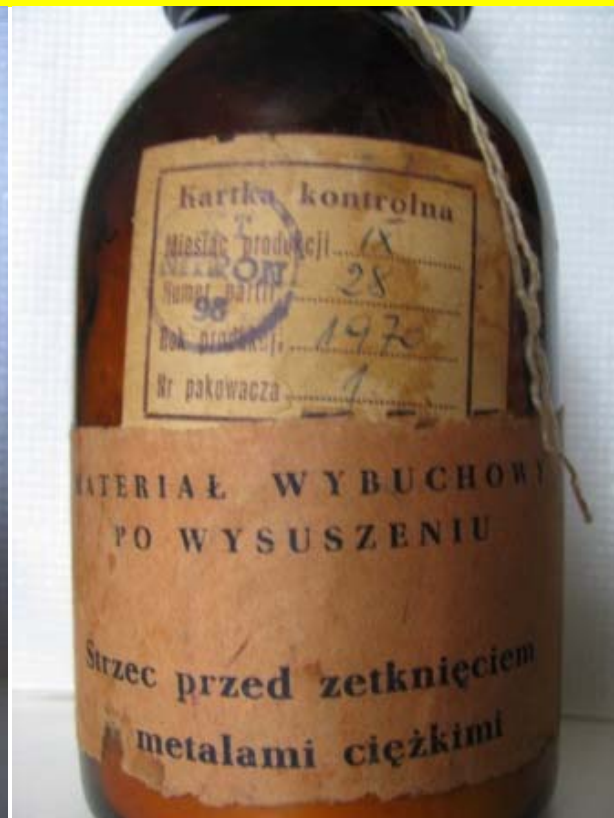
Kwas Pikrynowy (пикриновая кислота, производство Польша)