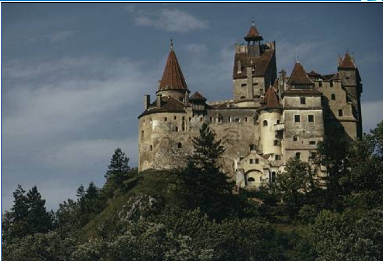
Замок графа Дракулы сегодня

Положение было отчаянным, и Влад сделал все возможное, чтобы выстоять в этой неравной схватке. Он призвал в армию все мужское население княжества, начиная с двенадцатилетнего возраста, применял тактику выжженной земли, оставляя врагу сожженные деревни, где невозможно было пополнить запасы продовольствия, вел партизанскую войну. Еще одним оружием князя стал панический ужас, который он внушал захватчикам. Защищая свою землю, Дракула безжалостно истреблял врагов, в частности, сажал пленных на кол, используя против турок очень "популярную" в самой Османской империи казнь.