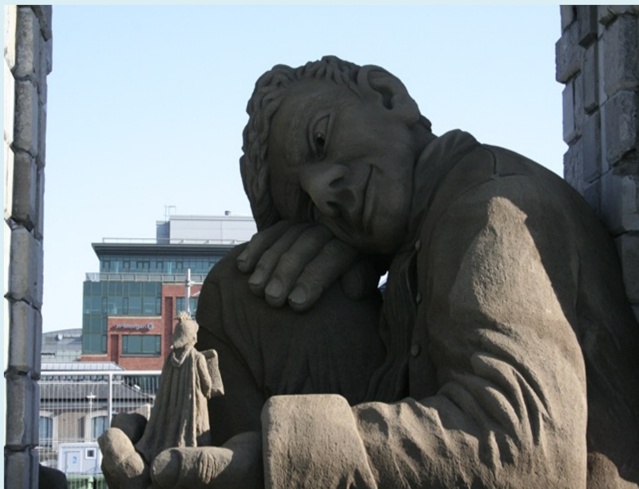
Памятник Лемюэлю Гулливеру – первооткрывателю нанотехнологии