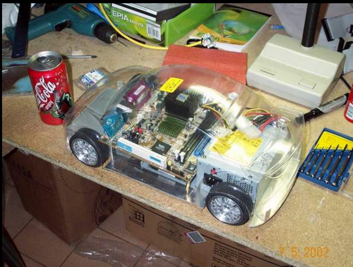
Системный блок компьютера в корпусе игрушечного автомобиля