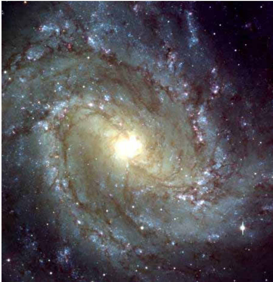
Центральная область спиральной галактики Messier 83.

В галактике, к которой принадлежит Солнечная система около 200 млрд. звезд. Во Вселенной около 10 млрд. галактик.