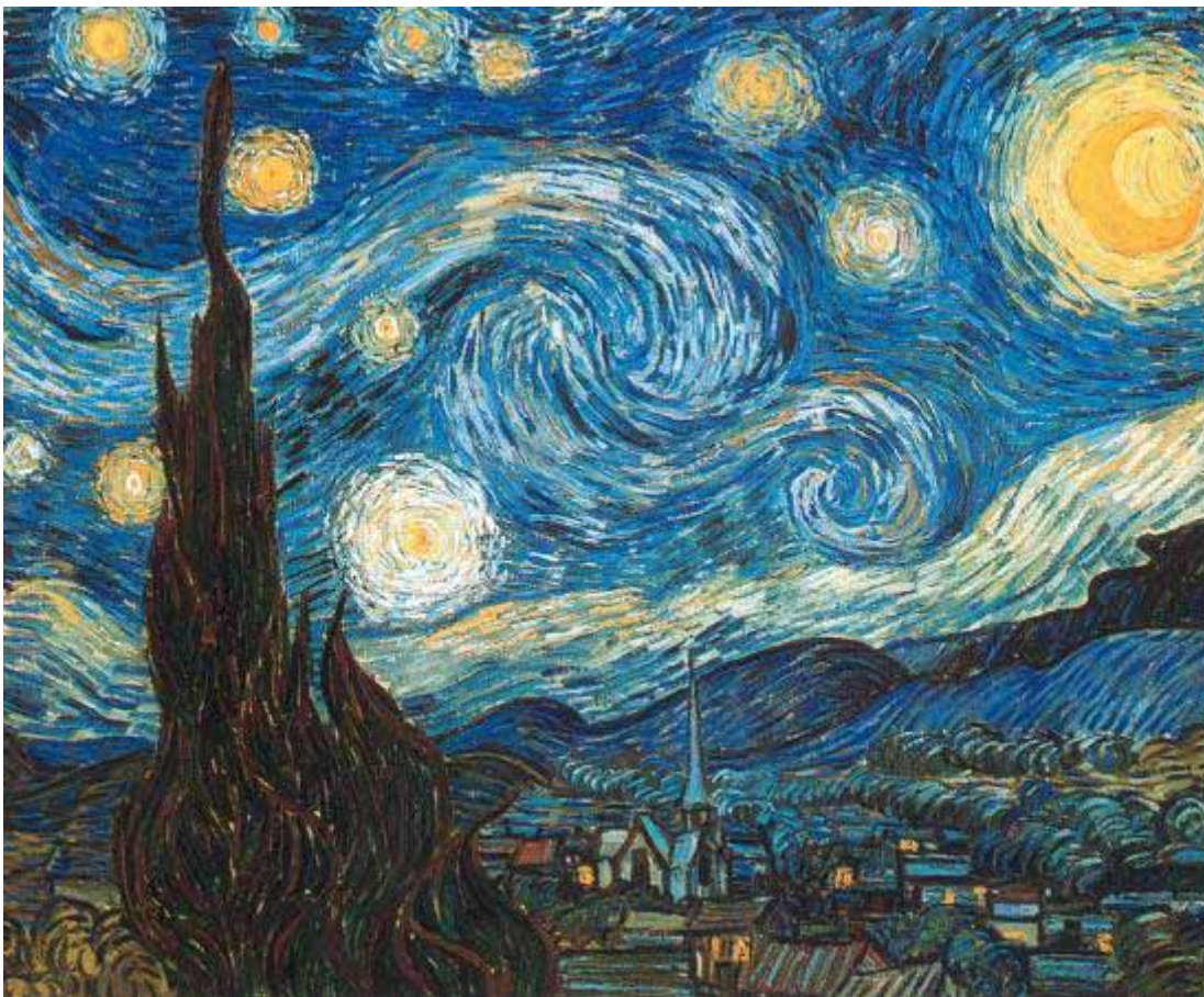
Винсент Ван Гог. «Звездная ночь».