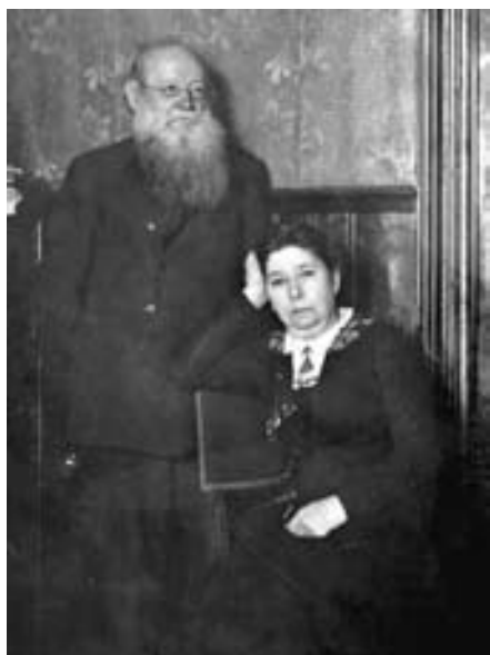
П. А. Кропоткин и его жена Софья Григорьевна (1918 г.)