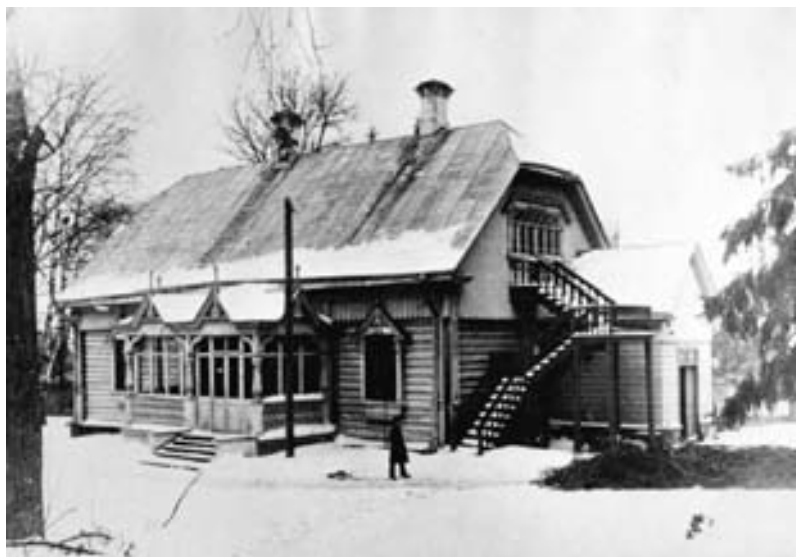
Дом П.А. Кропоткина в Дмитрове. Февраль 1921 г.