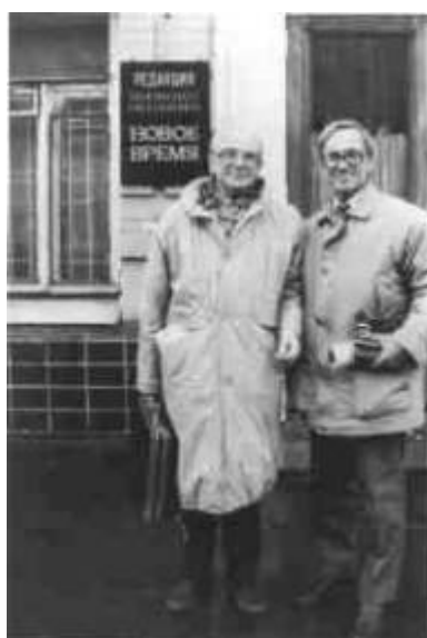
После интервью журналу «Новое Время». 21 сентября 1992 г.