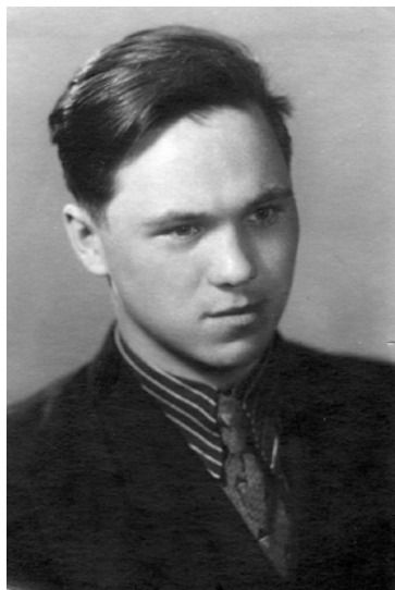
Студент МИТХТ им. Ломоносова. 1956 г.

закончен, а допускать меня, медалиста, к приемным экзаменам на общих основаниях он не имеет права.