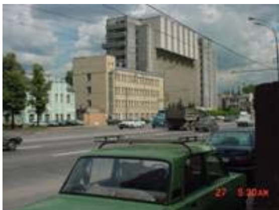
Административное здание ГосНИИОХТ. 2002 г.

Старые грязные здания, мимо которых я прошел, были построены по меньшей мере в прошлом веке и вид их способен был привести в ужас кого угодно. Даже проработав много лет в ГСНИИОХТ, я никак не смог избавиться от неприятного ощущения, возникавшего при виде этих мрачных строений. Многие из них затам, к началу 90-х годов уже были наполовину уже были разрушены и вместо них кое-где появились новые безликие здания. Правда, новый девятиэтажный административный корпус, выходящий фасадом на Шоссе Энтузиастов, не был лишен определённой архитектурной привлекательности, но он, служа фасадом "почтового ящика", лишь частично прикрывал отталкивающий вид всё ещё существующих зданий бывшей тюрьмы для политзаключённых.