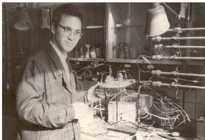
Аспирант Института нефтехимического синтеза АН СССР. 1963 г.

Осенью 1960 года, успешно сдав вступительные экзамены, я поступил в аспирантуру нефтехимического синтеза АН СССР. Правда, пришлось пережить критический момент во время экзамена по истории КПСС. Я ошибся, отвечая на вопрос о повестке дня какого-то большевистского съезда. Экзаменующий меня щедушный доцент из всех сил задавал мне наводящие вопросы, но я так и не смог вспомнить, о чем же вели речь большевики. Оскорбленный таким неприлежанием, начётчик гневно вклеил мне тройку. Я уже решил было, что из-за тройки по такому "важному" предмету меня не примут в аспирантуру и мне придется вернуться ещё на один год к своим "боранам". Но в институте к моей отметке отнеслись довольно миролюбиво. Видимо, к тому времени многие уже понимали никчемность самого экзамена по марксизму-ленинизму для начинающего химика. Но через год мне еще предстояло сдавать заново, предварительно проходя умопомрачительно скучные еженедельные семинары в Академии общественных наук, которая располагалась напротив бассейна "Москва" (теперь там вновь построили Храм Христа Спасителя).