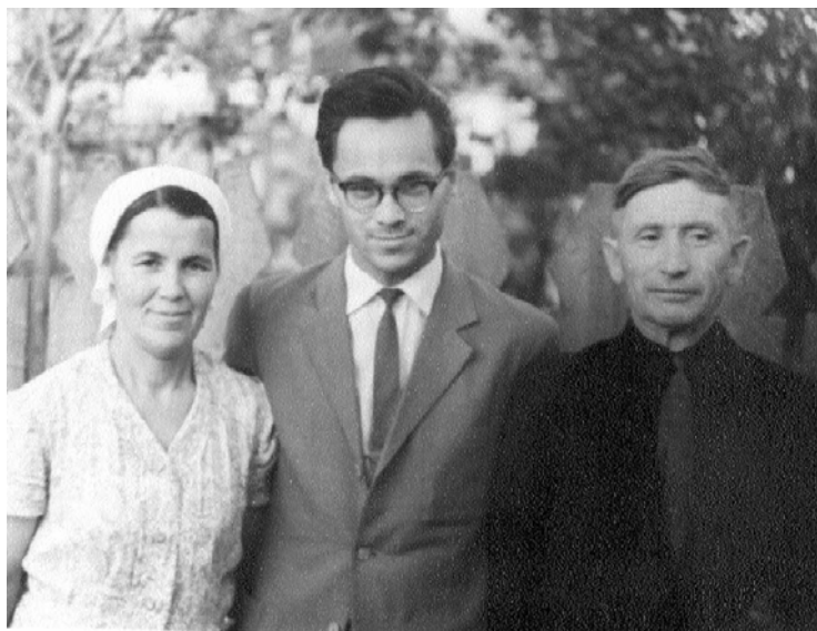
С родителями. 1969 г.

Полагаю, что в дальнейшем многие поступки отца объяснялись тем, что он стремился доказать: его происхождение ничего не значит в вопросе лояльности новому режиму и он готов служить ему всей верой и правдой. Отец стал убежденным коммунистом. Не хочу ни обвинять, ни оправдывать его, поскольку другого выбора у него не было. Поскольку по всем статьям того времени он был глубоко враждебным элементом, выжить иным способом он бы не смог.