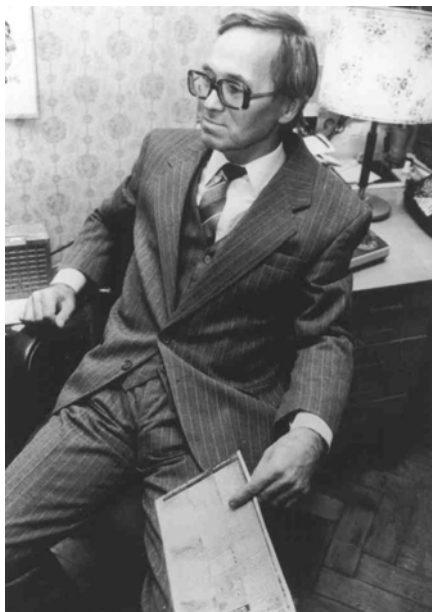
Даю интервью в редакции журнала «Новое Время». 21 октября 1992 г.

Интервью было опубликовано в журнале за № 44 от 27 октября 1992 года под названием "Бинарная бомба взорвалась".